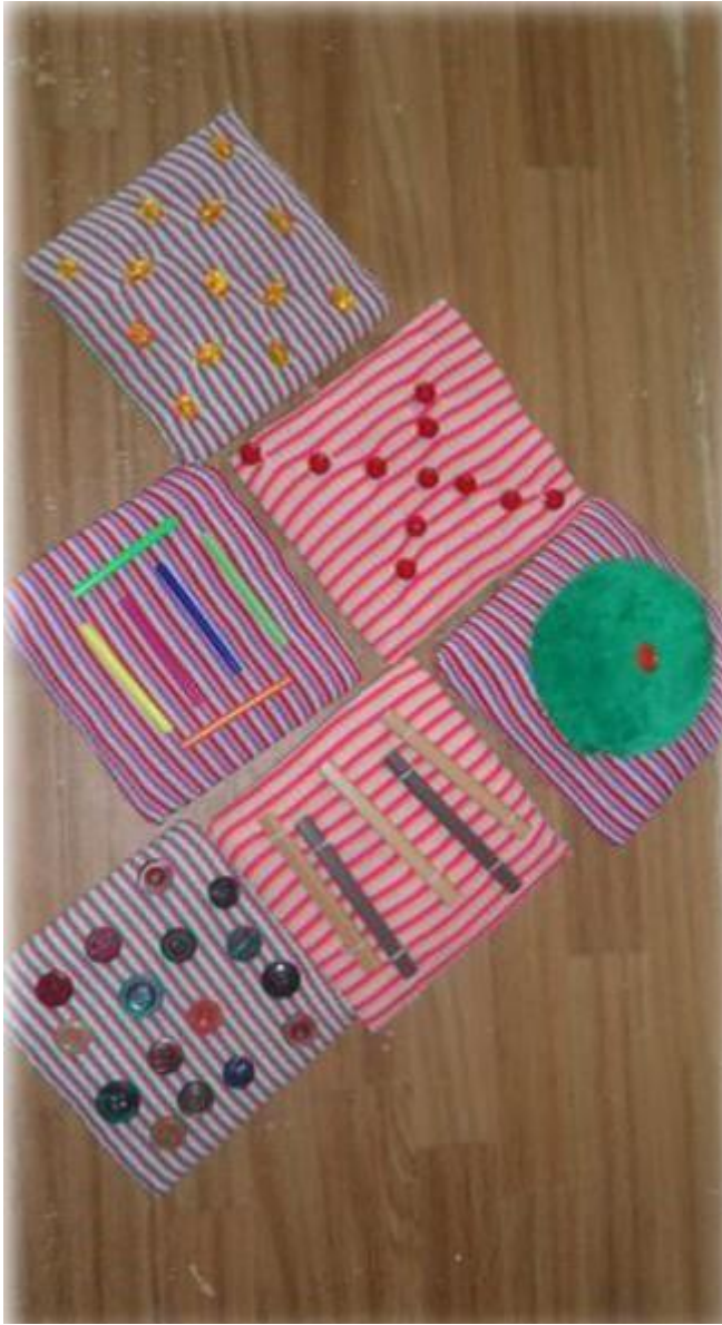
Физкультурные карточки «Повторяй за мной» Цель : развитие основных видов движений.